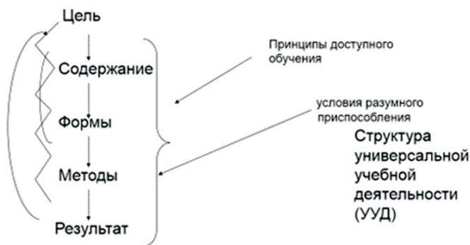
Рис. 3. Комплексный подход в осуществлении деятельности ДООЛ, в контингент которого входят дети с ОВЗ

Проводимое мероприятие должно быть целевым, с серьёзно проработанным содержанием; подготовкой к участию каждого отряда; наличием непосредственных проектных заданий для всех категорий детей (Рис. 3).